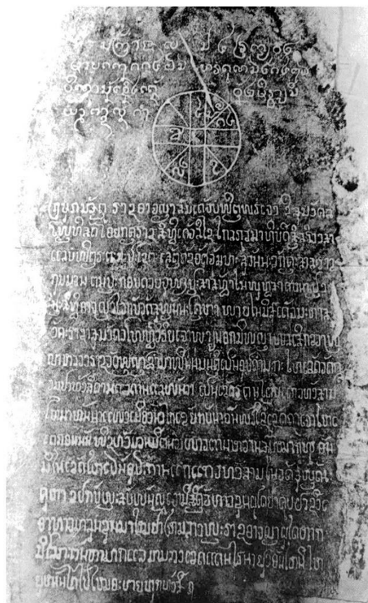
ด้านที่ ๒